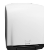
90045 Katrin Plastic Dispenser For System Paper Towel Roll, White