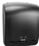
92025 Katrin Plastic Dispenser For System Paper Towel Roll, Black