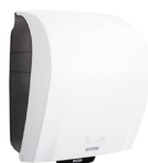
40735 Katrin Plastic Dispenser Extra Large For System Paper Towel Roll, White