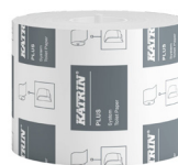
66940 Katrin Plus Dispenser Toilet Paper Roll System 800 Sheets 2-Ply