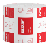
103424 Katrin Dispenser Toilet Paper Roll System 800 Sheets 2-Ply