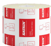
156104 Katrin Dispenser Toilet Paper Roll System 567 Sheets 2-Ply, Yellow

Medzinárodná ponuka, dostupnosť produktu pre SK nájdete na stránke.