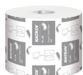
156050 Katrin Plus Dispenser Toilet Paper Roll System 680 Sheets 2-Ply