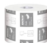
968 Katrin Plus Dispenser Toilet Paper Roll System 500 Sheets 3-Ply