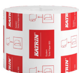
156007 Katrin Dispenser Toilet Paper Roll System 800 Sheets 2-Ply