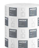
460058 Katrin Plus Dispenser Paper Towel Roll System Medium 2-Ply