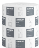
58167 Katrin Plus Dispenser Paper Towel Roll System Medium 2-Ply