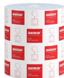
460218 Katrin Dispenser Paper Towel Roll System Medium 1-Ply, Blue