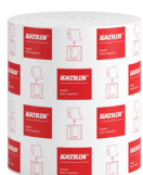
58198 Katrin Dispenser Paper Towel Roll System Medium 2-Ply