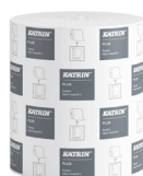
38015 Katrin Plus Dispenser Paper Towel Roll System M 3-Ply