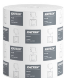
57795 Katrin Plus Dispenser Paper Towel Roll System Medium 2-Ply