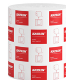
460102 Katrin Dispenser Paper Towel Roll System Medium 2-Ply